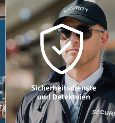
Sicherheitsdienste und Detekteien