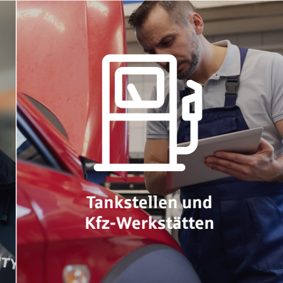
Tankstellen und Kfz-Werkstätten