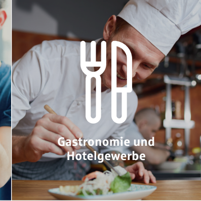
Gastronomie und Hotelgewerbe